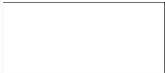
czytelny podpis reprezentanta

Wypełniony wniosek prosimy wysłać jednym wybranym sposobem: